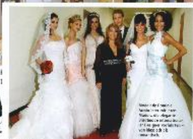
Große Brautmodenschows auf der „Hochzeitswelt“