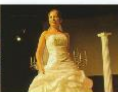
Die künftigen Bräute und alle anderen Interessierten konnten sich einen Überblick...