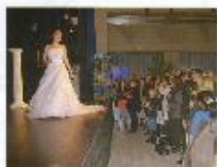
Den zahlreichen Besuchern wurde eine Modenschau geboten

Um sich auf den schönsten Tag seines Lebens vorzubereiten, bedarf es einer sorgfältigen Vorbereitung. Professionelle Hilfe ist dabei wirklich viel wert und somit lohnt sich wohl für viele angehende Brautpaare der Gang auf die Neusässer Hochzeitsmesse. Hier ein paar Eindrücke und auch viele Ideen- und Inspirations für künftige Brautpaare.