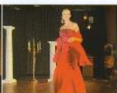
... über die aktuelle Brautmode verschaffen. Wie wär's denn mal mit rot?